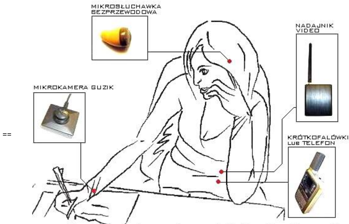
Rys: Część nadawcza zestawu - wykaz urządzeń jakie należy mieć przy sobie.